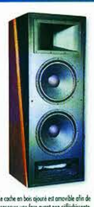
Le cache en bois ajouré est amovible afin de conserver une face avant non réfléchissante.