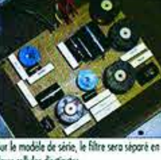
Sur le modèle de série, le filtre sera séparé en deux cellules distinctes.