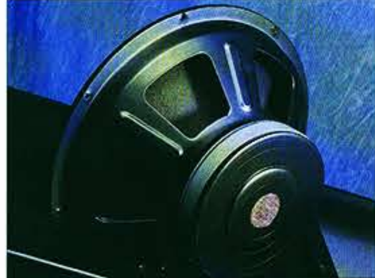
L'association de matériaux nobles : acier + pulpe de cellulose + fessu est gage de longévité.

L'Exclusive est une deux voies accordée. Le registre grave fait appel à un couple de transducteurs de 38 cm de Ø chargés par un volume de 260 litres optimisés selon les paramètres de Thiele et Small. Même si un seul 38 cm permet déjà de tutoyer les 50 Hz, un couple de 38 cm fonctionnant en parallèle permet d'obtenir une pression acoustique incomparable. Le constructeur revendique le 40 Hz à 0 dB. L'écoute confirmera ces performances hors du commun. L'évent d'accord de forme rectangulaire débouche en face avant au pied de l'enceinte. Son embouchure comme sa sortie sont tendues de tissu. Cet évent est en fait constitué d'un coffret, généreusement amorti par de la laine de verre et de roche, qui contribue à rigidifier le panneau du baffle-support.