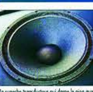
Un superbe transducteur qui dame le pion aux productions étrangères.

Caractéristique d'impédance en fonction de la fréquence de la GKF Exclusive. Le module d'impédance est de 5,8 Ω. L'accord grave est situé très bas, vers 26 Hz. Réponse assez homogène.