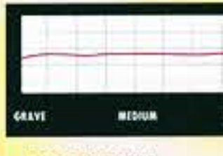
GRAVE MEDIUM AIGU

Depuis longtemps, nous attendions, comme le Messie, l'arrivée d'une enceinte de rêve alliant les avantages du haut rendement avec les atouts de la haute linéarité de réponse, de la neutralité de timbre, de la haute définition, de la dynamique très poussée, de la tenue en puissance très élevée et de la faible directivité. On n'osait pas demander en prime un prix très étudié, ce qui est pourtant le cas de la GKF Exclusive. Elle lance à ce titre un vrai défi à la concurrence. Attention, car une pièce d'écoute d'au moins 50 m 2 s'impose d'office, vu que l'on dispose dans le registre grave d'une surface active répartie sur 4 haut-parleurs de 38 cm. Mérite d'être valorisé par les meilleures électroniques du marché.